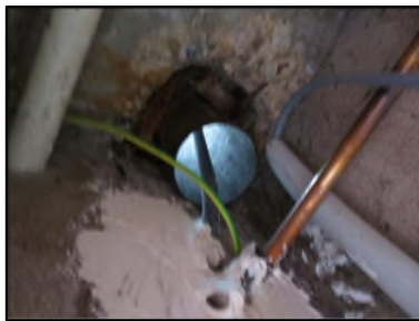
Photo N° 656 AMIANTE CIMENT -- GAINE TECHNIQUE GAZ 4 Conduits de fluide Ventilation haute (Fibres- ciment)